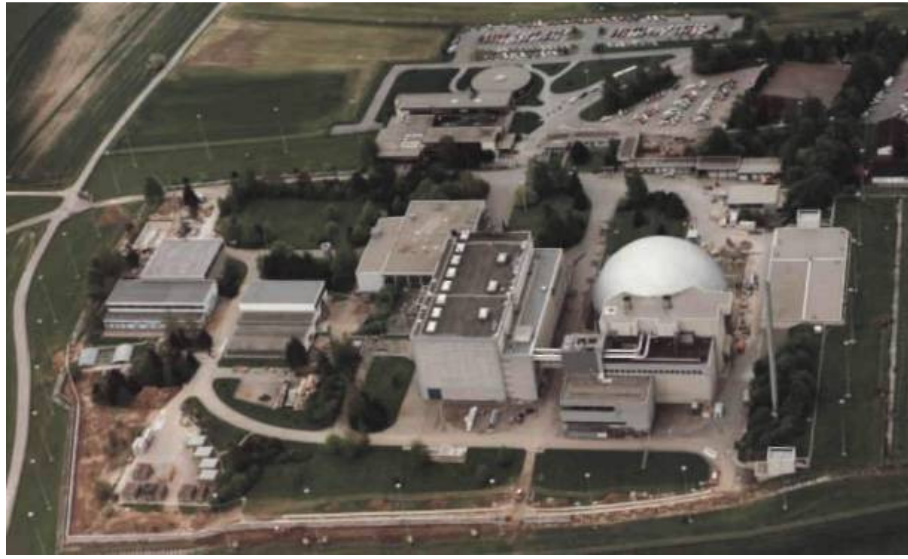
Згорання: за сучасним німецьким законодавством атомні електростанції будуть зупинені протягом близько 32 років. На фото — АЕС «Обрігайм», зупинена 11 травня 2005 р., після 36-річної експлуатації.

Атомна енергія використовується обмеженим колом країн світу. Лише 31 країна, або 16% з 191 країни-члена ООН, експлуатують атомні електростанції. Велика шістка — США, Франція, Японія, Німеччина, Росія, Південна Корея — вироблять приблизно три чверті атомної електроенергії в світі. Половина країн, які мають доступ до атомної енергетики, розташовані у Західній та Центральній Європі, та відповідають за третину світового виробництва атомної енергії. Історичного піку у 294 робочих реактори у Західній Європі та Північній Америці було досягнуто вже в 1984 році. Фактично спад атомної енергетики, непомічений громадськістю, почався вже багато років тому.